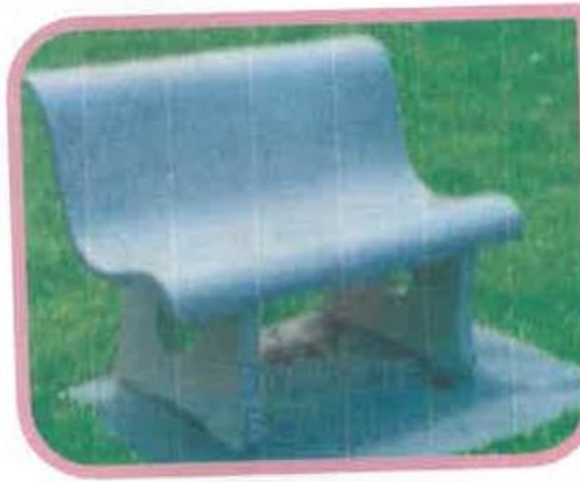
5. Bangku berehat jenis “ concrete bench ”