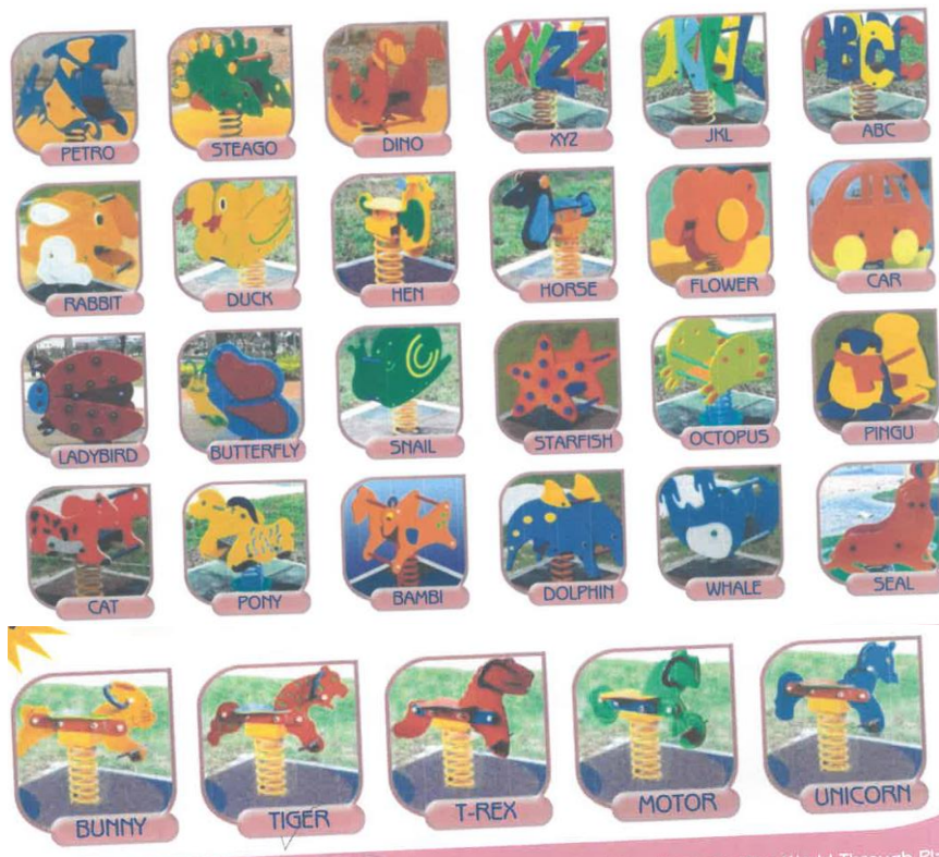
4. “Spring Rider”