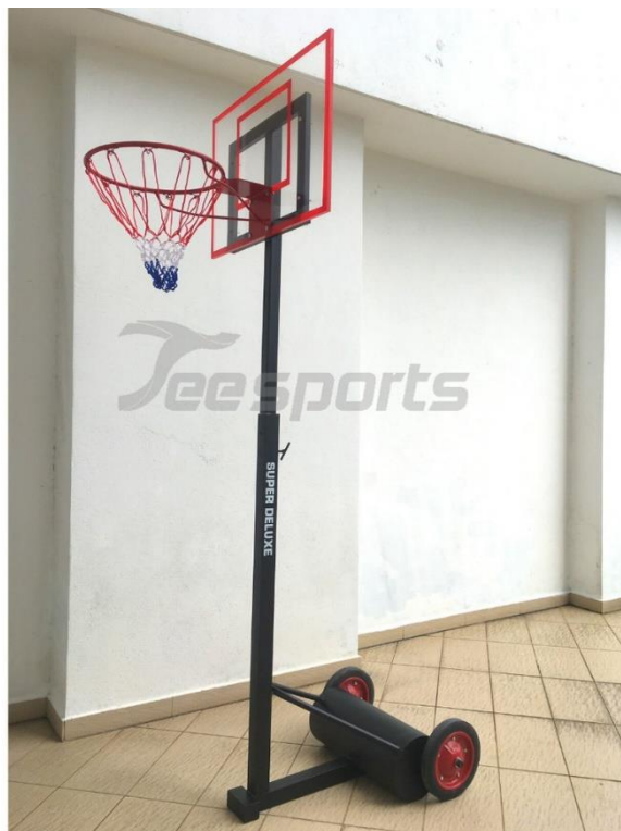
6. Portable Basketball